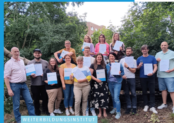
15 neue Fachkräfte Täterarbeit häusliche Gewalt nach BAG TäHG (FTHG®)

2025 gründete sich zudem ein Beirat für unser Weiterbildungsinstitut. Der Beirat setzt sich aus Personen zusammen, die die unterschiedlichen Perspektiven und Expertisen auf das Weiterbildungsinstitut repräsentieren und die BAG TäHG in der weiteren fachlichen und strategischen Ausrichtung des Weiterbildungsangebotes beraten werden. Das Auftakttreffen fand am 06.11.2025 statt.